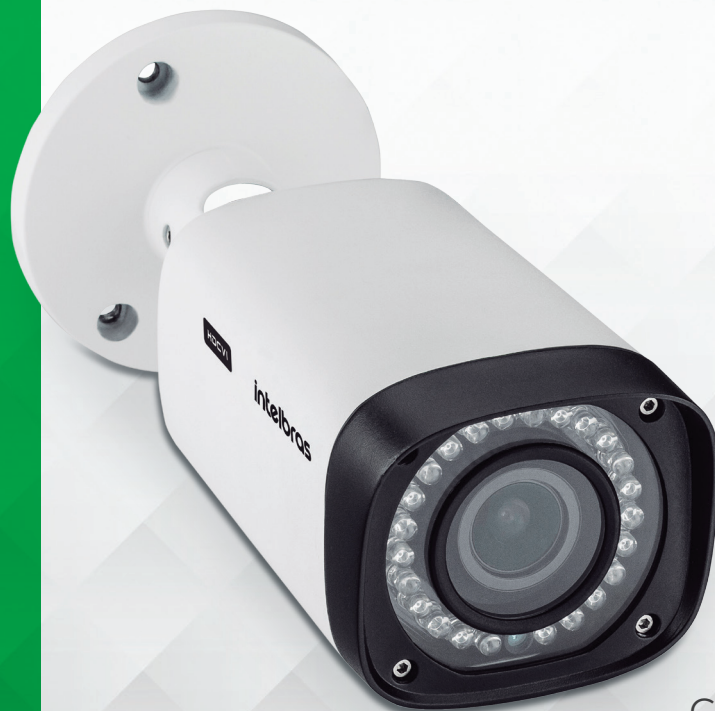
Câmera HDCVI varifocal com infravermelho