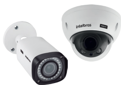
Câmeras HDCVI com resolução FULL HD